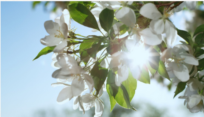
Kuva 3 - Kukkivia omenoita.

Jääsiiderin määritelmässä luonollinen kylmä on yhteinen nimittäjä jääsiiderin tuotannolle. Jääsiiderin tuotannon kansainvälisessä luokituksessa esitetään kaksi menetelmää sokerin tiivistämiseksi omenamehuun: kryouutto ja kryokonsentraatio. Brännland Isciderissä omenamehun kryokonsentraatio jääsiideriä varten tehdään omenamehun jäätämisen ja valutuksen toistojen kautta. Kryouutossa omenoiden annetaan pysyä puissa, kunnes niissä oleva mehu on tarpeeksi tiivistynyttä jääsiiderin tuotantoon. Brännland Iscider ei vielä tee kryouuttoa.