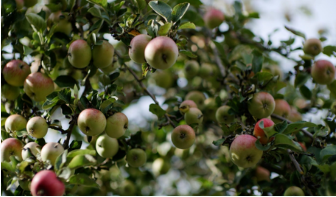
Kuva 2 - Omenoita.

Pohjoiset lajikkeet ovat paljon monipuolisempia ja vielä monipuolisempia tulevaisuudessa, kun kaikkien valittujen kylmänkestävien lajikkeiden istutetut omenapuut alkavat tuottaa enemmän hedelmiä.