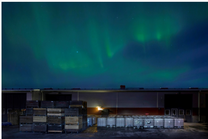
Kuva 1 - Brännland Isciderin siideritehdas revontulien valossa.

Author: Tanja Kähkönen, European Forest Institute (EFI)